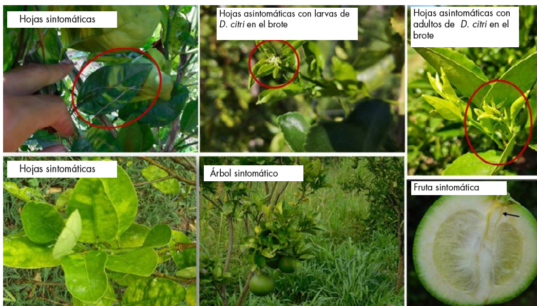
• Principales síntomas de HLB en plantas, hojas y frutos de cítricos (ASSOFWI)