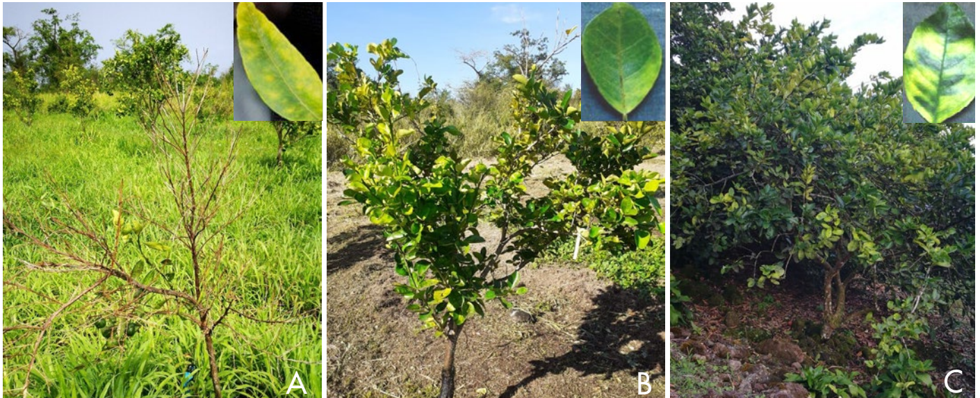
• Parcelas de cítricos infectadas en Guadalupe: A, mandarinas; B, naranjas; C, lima

Los cítricos son el cultivo de árboles frutales más importante del mundo, con una producción anual estimada en 165 millones de toneladas (FAOSTAT, 2019). El “huanglongbing” (HLB) se considera la enfermedad más destructiva de las especies comerciales de cítricos, afecta a todas las variedades, reduciendo gravemente el rendimiento de los cultivos. La enfermedad está asociada a la presencia de la especie ‘ Candidatus Liberibacter ’ y es transmitida por los psílidos Diaphorina citri y Trioza erytrae . Hasta la fecha, el HLB está presente en todos los continentes, excepto Australia y Europa continental, aunque en 2014 se detectó uno de sus insectos vectores en la Península Ibérica (Cocuzza et al. , 2017). Su impacto es muy elevado en América y África. Por ejemplo, en Florida, el HLB causó pérdidas por valor de 4.554 millones de dólares en sólo seis años (2005-2011) (Hodges y Spreen, 2012). Dado que no existe un control eficaz, salvo evitar que los árboles se infecten, es esencial que se conozca la enfermedad y se identifiquen rápidamente sus síntomas. Sin embargo, sigue habiendo una clara falta de información sobre el “huanglongbing”, especialmente en los países que están libres de la enfermedad.